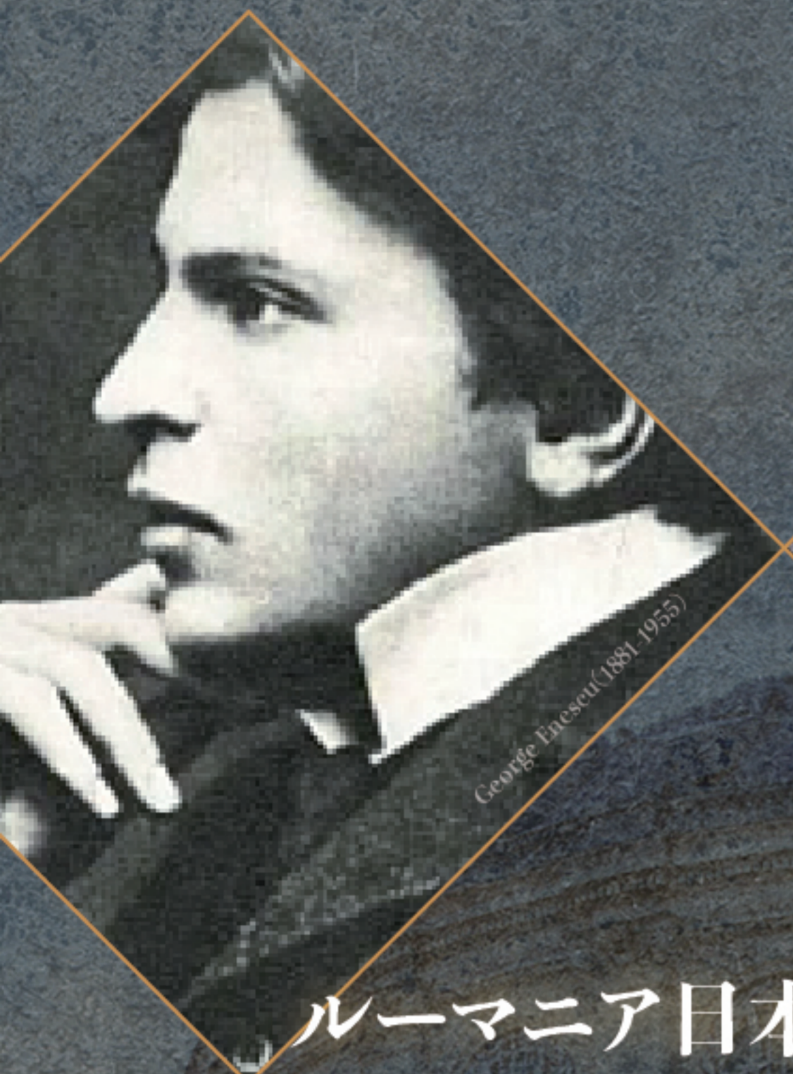
George Enescu (1881-1955)