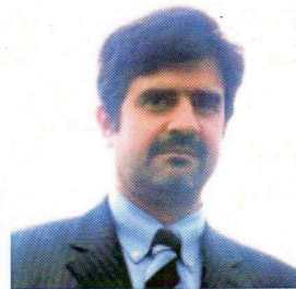
アレクサンドル・フザ